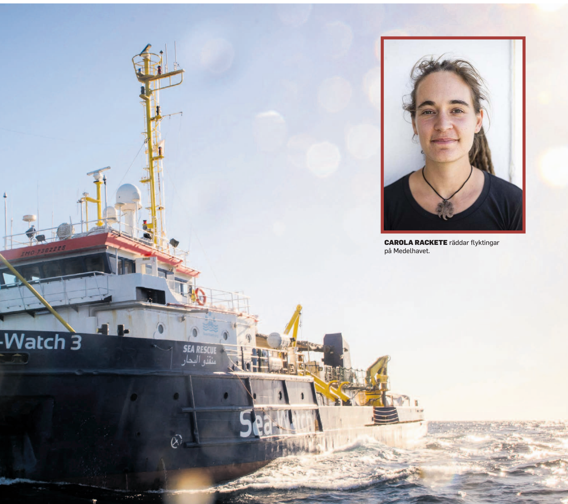
CAROLA RACKETE räddar flyktingar på Medelhavet.

att komma närmare strandpromenaden trodde vi att tullvakterna skulle motsätta sig det. Jag försökte undvika dem men från kommandobryggan kunde jag inte se patrullbåten. Jag gjorde en felaktig uppskattning, kontakten kunde ha undvikits. Det skulle inte ha hänt om jag inte hade varit så utmattad. Jag hade inte sovit på flera dagar, jag väcktes stup i kvarten eftersom jag hela tiden var tvungen att fatta beslut ombord.